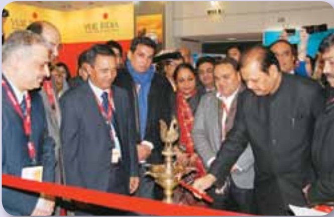
Photograph shows Shri Subodh Kant Sabai, Hon'ble Minister of Tourism inaugurating the India Pavilion

With more than 170,000 visitors, among these 108,000 trade visitors, and over 10,000 exhibitors from 180 countries, ITB Berlin is the leading B2B-Platform of all tourism industry offers. In addition, the world's largest tourism convention - ITB Berlin Convention - provides unique opportunities to benefit from the leading think tank of the global tourism industry consisting of tour operators, airlines and hotels.