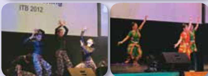
Some highlights of the India Evening